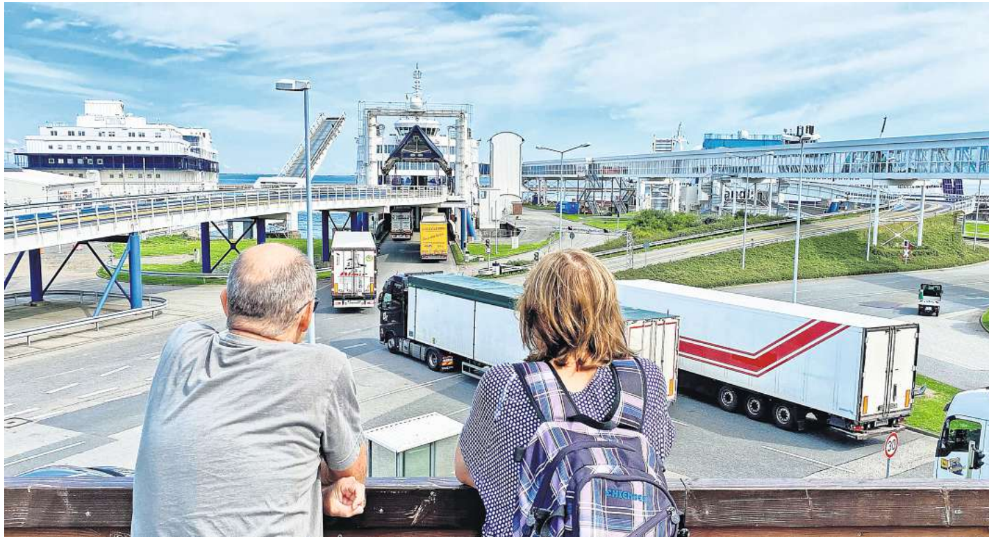
Beindruckende Frachtmengen auf Fehmarn: Die Reederei Scandlines verzeichnet auf ihren Routen zwischen Puttgarden und Rødby sowie zwischen Rostock und Gedser trotz der Corona-Handicaps im Frachtbereich ein Plus von zwölf Prozent gegenüber 2020.

Seit dem Ausbruch von Covid-19 halte Scandlines den Betrieb auf seinen Ostsee-Routen zwischen Puttgarden und Rødby sowie zwischen Rostock und Gedser trotz aller Handicaps aufrecht, „auch um Frachtkunden und kritische Lieferketten verlässlich zu bedienen“. Und das durchaus mit Erfolg. Denn Poulsen meldete: „Mit einer